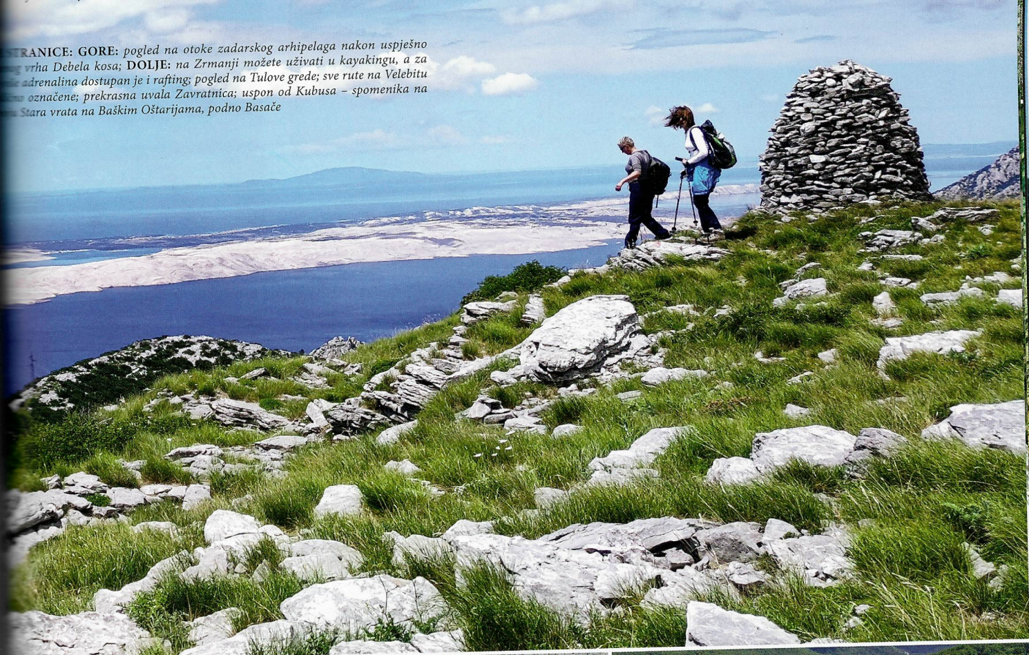
GRANICE: GORE: pogled na otoke zadarskog arhipelaga nakon uspješno ...vrha Debela kosa; DOLJE: na Zrmanji možete uživati u kayakingu, a za ...adrenalina dostupan je i rafting; pogled na Tulove grede; sve rute na Velebitu ...označene; prekrasna uvala Zavratnica; uspon od Kubusa - spomenika na ...Stara vrata na Baškim Oštarijama, podno Basače

na tom činjenicom jer sam oduvijek maštala i uživala u plavetnilu mora. Međutim, ove sam godine prvi put spremna potpuno zaobići more i uživati isključivo u planinama. Mislim da nema boljeg mjesta za to od prekrasnog Velebita, najvećeg zaštićenog područja u Hrvatskoj, na površini od 2.274 km 2 , čija ukupna dužina od 145 km, te širina koja se kreće u rasponu od 10 do 30 km, obećavaju čistu i apsolutnu ljepotu. Velebit treba upoznati i uzduž i poprijeko, uživajući u planinarenju po mnoštvu dobro markiranih staza. Terezijanska cesta, Majstorska cesta i Premužićeva staza, koja povezuje vršne dijelove sjevernog i srednjeg Velebita, zaštićena su kulturna dobra Hrvatske. Ljubitelji prirode zaista će uživati prolazeći sve njegove poučne staze, a osim pješaćenja, na nekim dije-