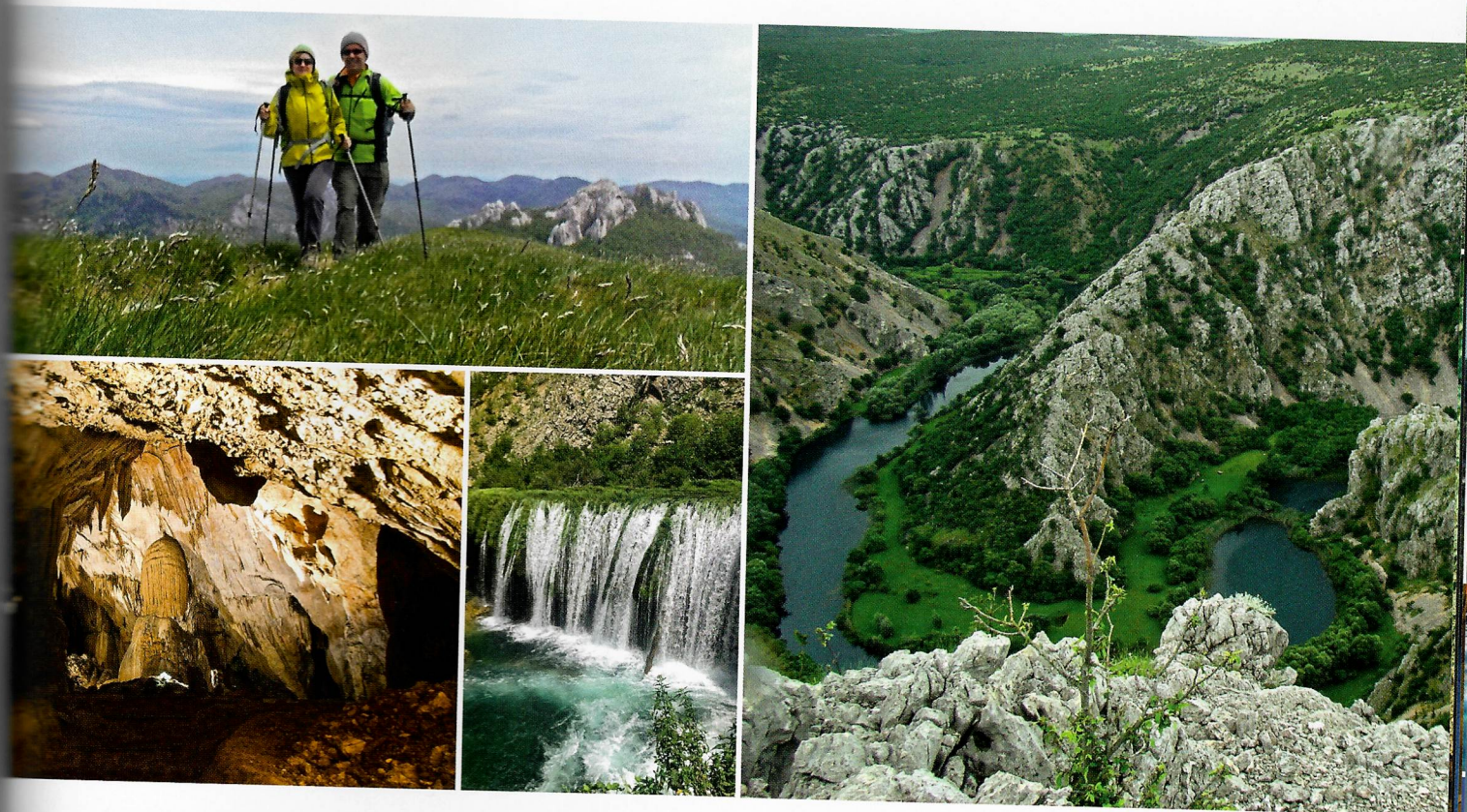
OVAKVA STRANICA: VELIKA FOTOGRAFIJA: Visočica; MALA FOTOGRAFIJA: flora i fauna Velebita; OVA STRANICA: GORE: zadovoljstvo planinara nakon osvojenog vrha; DOLJE LIJEVO: Cerovačke špilje; SREDINA: slap na rijeci Zrmanji; DESNO: pogled na rijeku Krupu

Park prirode Velebit skriva mnoge prirodne ljepote i zaštićena područja. Uvala Zavratnica, Velnačka glavica, Cerovačke špilje, kanjoni rijekā Zrmanje i Krupe te posebni rezervat šumske vegetacije Štirovača, samo su neka od njih.