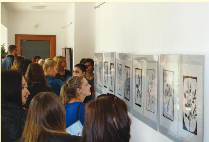
Izložba studentskih grafika „Tragom Vile Velebita“ u upravnoj zgradi Javne ustanove „Park prirode Velebit“